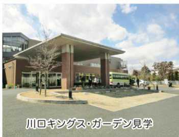
川口キングス・ガーデン見学

実現には多くのクリアすべき課題があり、計画も緻密に練っていく必要がありますが、「笑顔のつながるコミュニティー」の一角として実現できるように、一つ一つ真摯に取り組んでいきます。