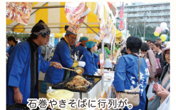
石巻やきそばに行列が。お昼過ぎには完売しました

毎年恒例の横浜市栄区の大規模なイベント、栄区民まつりが昨年11月に開催されました。当日は5万5千人の出入。栄区と交流のある石巻市もブースを構え、オアシスも石巻の物産や石巻やきそばを販売して石巻ブースを応援しました。収益は津波の被害で廃校になった学校の校歌をCDに収録するプロジェクトに寄付いたしました。