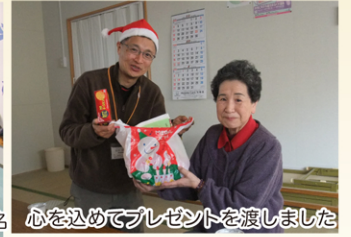
心を込めてプレゼントを渡しました