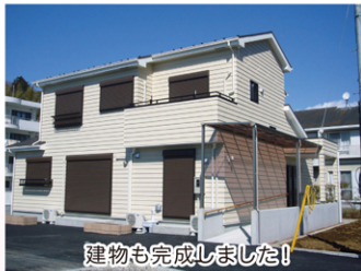
建物も完成しました!!

来る4月1日に、小規模ディサービス「でい・さろん泉」が栄区飯島町でスタートします。地域の皆さまの憩いと安らぎとなるよう願っています。