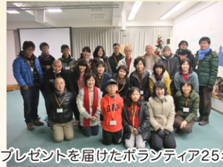
プレゼントを届けたボランティア25名

*協力企業* 株式会社豊島屋 株式会社ファンケル ヤマザキナビスコ株式会社 *ご支援を感謝します*